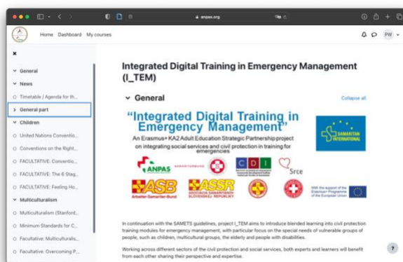
E-učenje u I_TEM koristilo je Moodle LMS

Za opsežan pregled različitih LMS softverskih proizvoda, pogledajte https://en.wikipedia.org/wiki/List_of_learning_management_systems .