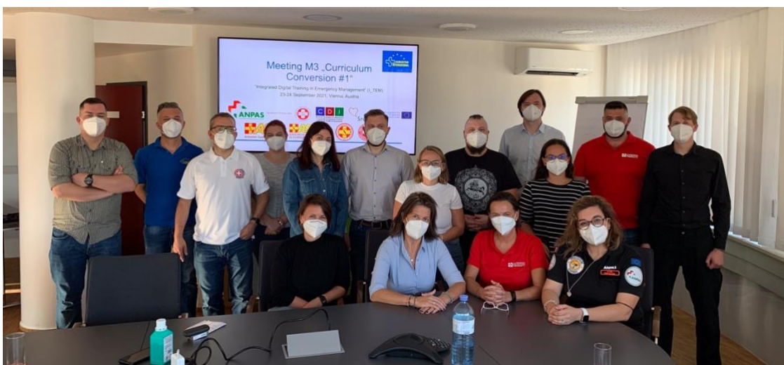
Rani radni sastanak projekta I_TEM 2021. – još uvijek u uvjetima pandemije

Ranije su već postojala nastojanja uključivanja socijalnih pitanja u upravljanje hitnim situacijama, uključujući neke članove I_TEM konzorcija u projektu SAMETS koji je sufinancirala EU. I_TEM je uzeo zaključke iz ovih ranijih projekata i izmijenio ih u dva glavna aspekta.