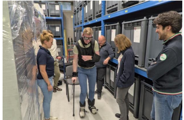
Obuka pilota - Iskusite vježbu kako biste stekli neformalno, ali dublje razumijevanje ciljne skupine

Poveznica na online kolo sreće je https://wordwall.net/it/resource/35472480/presentation (također navedena u našem online katalogu na https://item.samaritan-international.eu/online-catalogue )