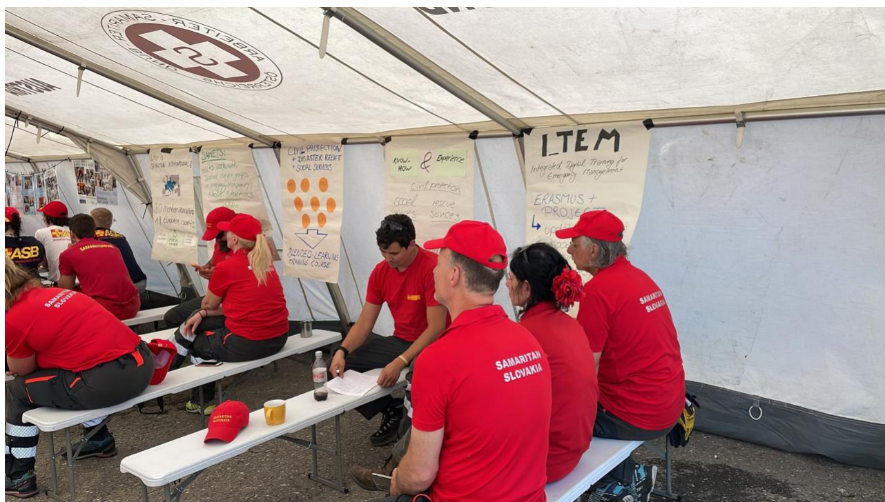
Multiplikatorski događaj - Predstavljanje rezultata projekta međunarodnim volonterima za hitne slučajeve tijekom vježbe