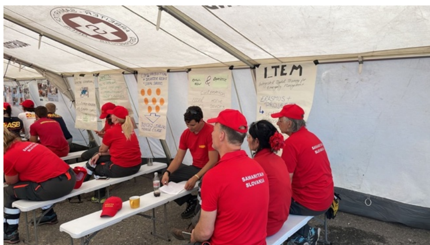
Projekto rezultatų pristatymas tarptautiniams skubios pagalbos savanoriams per pratybas