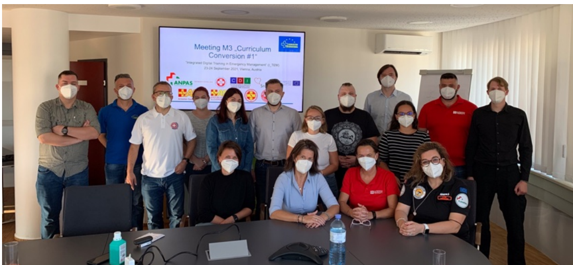
Pirmasis I_TEM projekto darbinis susitikimas 2021 m. - vis dar pandemijos sąlygomis

Todėl I_TEM stengėsi sumažinti atotrūkį tarp civilinės saugos ir socialinių paslaugų, kad